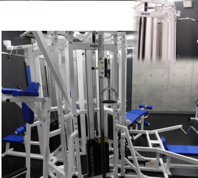
シングルハイ/ロー Max100kg